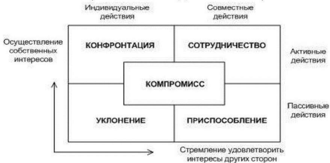
Схема стратегий поведения в конфликте

4. Расставьте в правильном порядке этапы преодоления конфликта